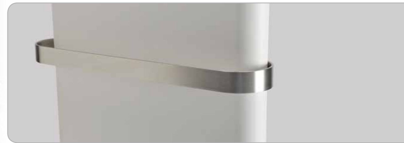
Le porte-serviette en acier inoxydable, en option qui s'impose dans la salle de bain, souligne le cachet du radiateur.

Tout architecte d'intérieur approuvera sans réserve votre choix d'un radiateur Tinos ou Paros. Minimalisme avec un grand M, qui s'intègre avec discrétion aux autres éléments de l'ameublement. Les formes et couleurs douces, naturelles sont aujourd'hui les composantes indissociables de la salle de bain. Des formes qui incitent naturellement au repos et procurent une sensation de bien-être. Sans dénigrer pour autant les lignes géométriques du Tinos, ce sont ici les rondeurs du Paros qui conviennent à la perfection. Ses doux arrondis apportent à votre salle de bain la touche finale, en assurant une agréable et douillette température.