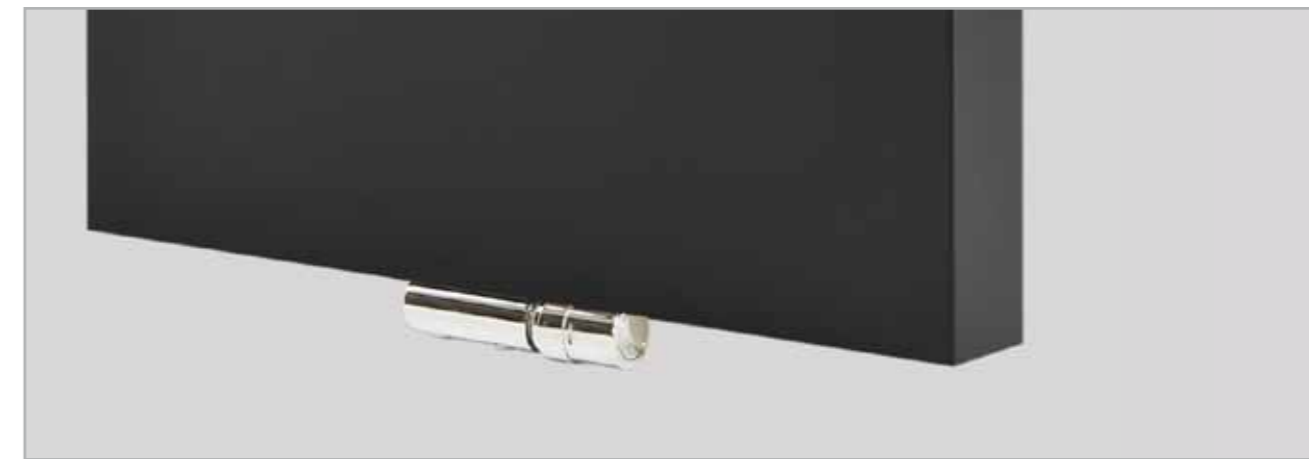
Corps de vanne assorti (en option), conçu pour souligner le design du radiateur.

Le design du Tinos comme du Paros s'adapte à chaque décoration intérieure. Que vous optiez pour une décoration romantique de votre chambre ou pour une décoration moderne minimaliste. Plus de 200 couleurs s'offrent à votre choix. Il y en a toujours une qui s'harmonisera à votre literie et linge favoris.