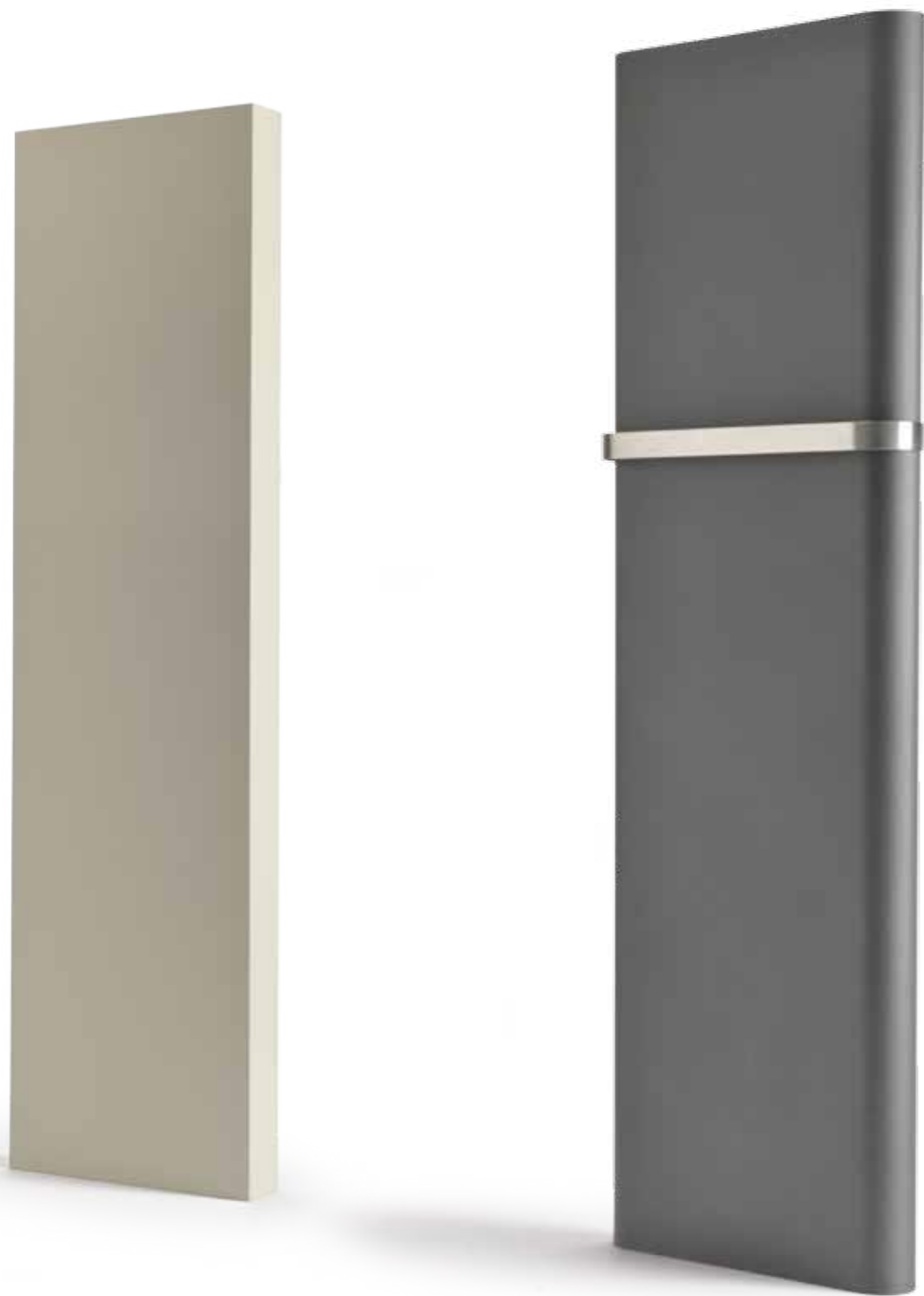
Porte-serviette en acier inoxydable (en option)