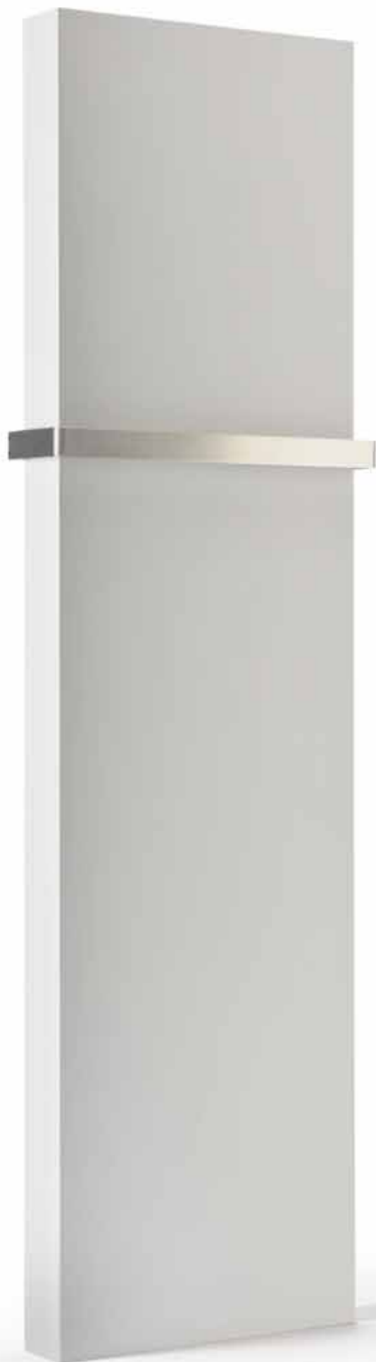
Porte-serviette en acier inoxydable (en option)